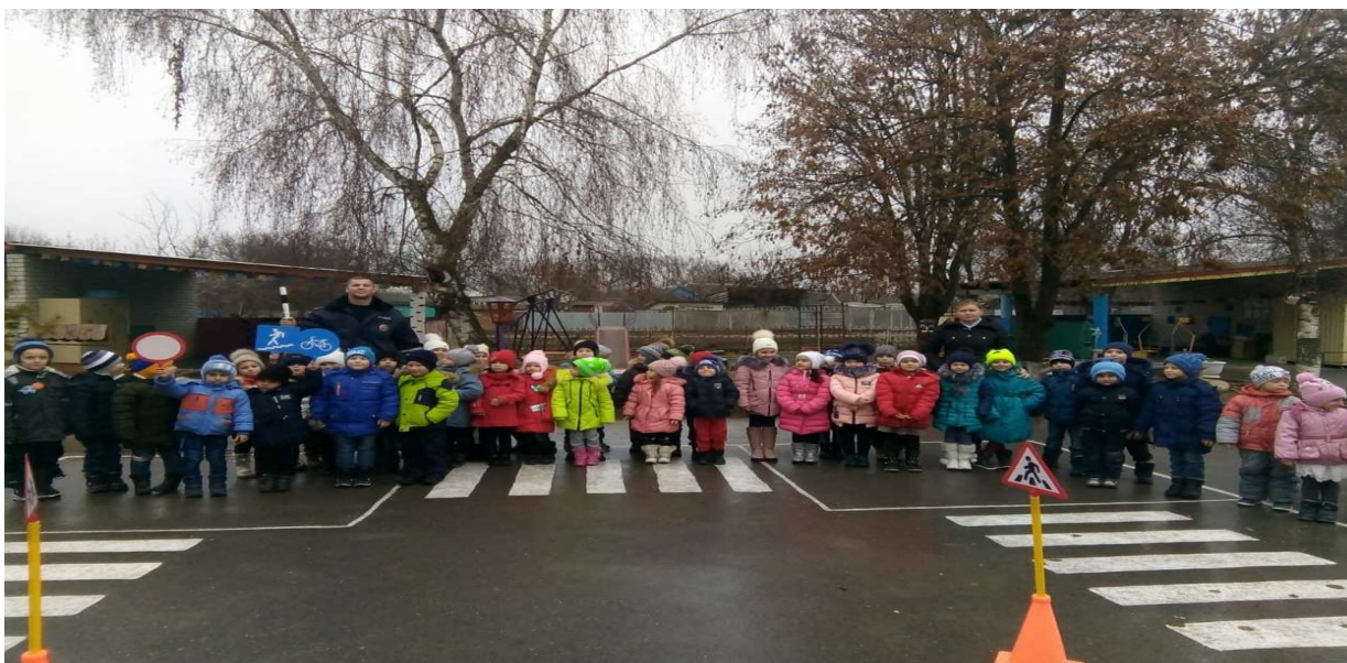
Группа компенсирующей направленности