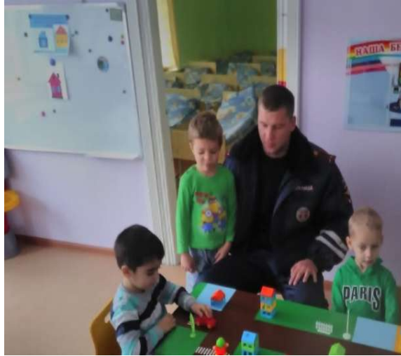
Старшая группа «Непоседы»